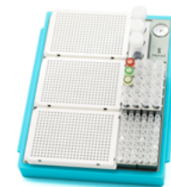
恒温金属冰盒基座 plus GT20501（马卡龙蓝）